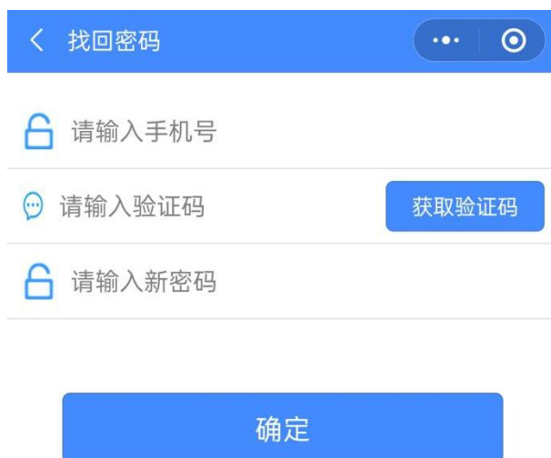
图 5 找回密码页面