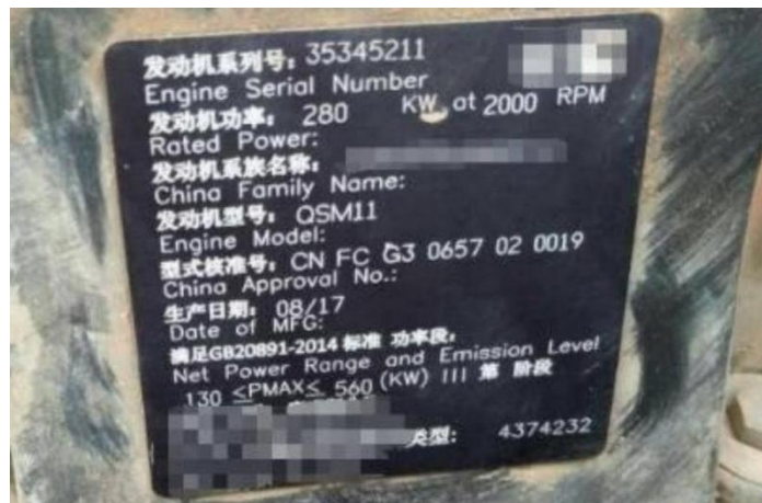
图 10 发动机铭牌图

2. 发动机铭牌是发动机厂家提供含有发动机基本信息的金属标识牌，它一般会明确发动机型式核准号、生产厂家名称、系族名称、型号、额定功率、生产日期、出厂编号、后处理类型、排放阶段等信息。固定在发动机使用寿命内不需要经常更换的部件上，通常会黏贴或铆接在发动机缸体上。具体示例详情如图 10 所示。