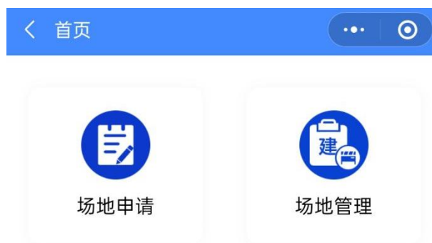
图 7 工地管理员进入页面

工地管理员进入系统后，先需要选择工地注册，工地注册后，才可以对该工地的机械做进出场管理。