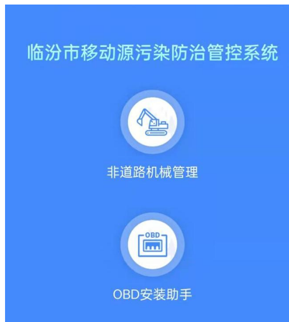
图 2 小程序进入页面