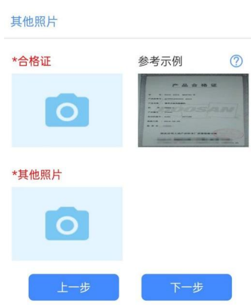
图 14 无铭牌机械资料图

其他机械资料是上传购机发票、其他必要说明的照片。点击添加图片按钮上传照片,没有点击下一步。具体界面详情如图 14 所示。