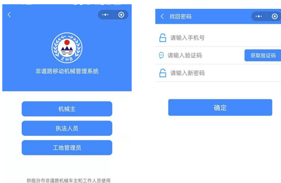
图 3 登录页面

当机械主忘记密码的时候，可以使用找回密码功能。在登录页底部，点击“忘记密码”进入找回密码界面，输入手机号，点击“获取验证码”，收到短信后，输入验证码，输入新的密码，点击“确定”即可设置新的密码。