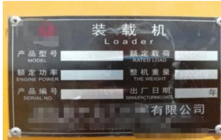
图 9 机械铭牌图

2. 发动机铭牌是发动机厂家提供含有发动机基本信息的金属标识牌，它一般会明确发动机型式核准号、生产厂家名称、系族名称、型号、额定功率、生产日期、出厂编号、后处理类型、排放阶段等信息。固定在发动机使用寿命内不需要经常更换的部件上，通常会黏贴或铆接在发动机缸体上。具体示例详情如图 10 所示。