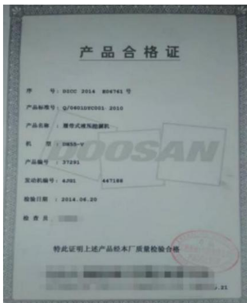
图 13 产品合格证示例图

其他机械资料是上传购机发票、其他必要说明的照片。点击添加图片按钮上传照片,没有点击下一步。具体界面详情如图 14 所示。