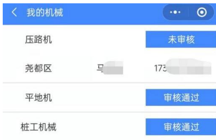
图 17 机械用户机械列表页