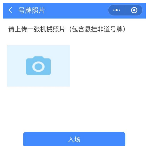
图 10 机械入场上传照片