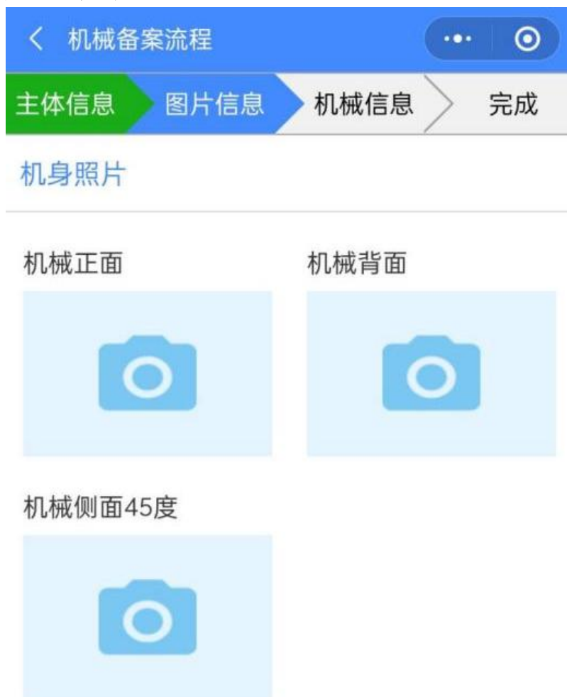
图 7 机身照片图

◆ 机械资料按有无铭牌分类，分为有发动机、机械铭牌和无发动机、机械铭牌，先选择有无铭牌。有发动机、机械铭牌的登记，机械资料须上传 4 张照片中任选至少一张照片；无发动机、机械铭牌的登记，机械资料须上传合格证照片。具体界面详情如图 8 所示。