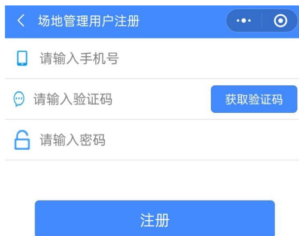
图 4 工地管理员注册页面