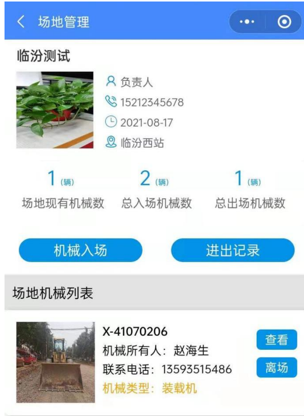
图 11 机械出场页面