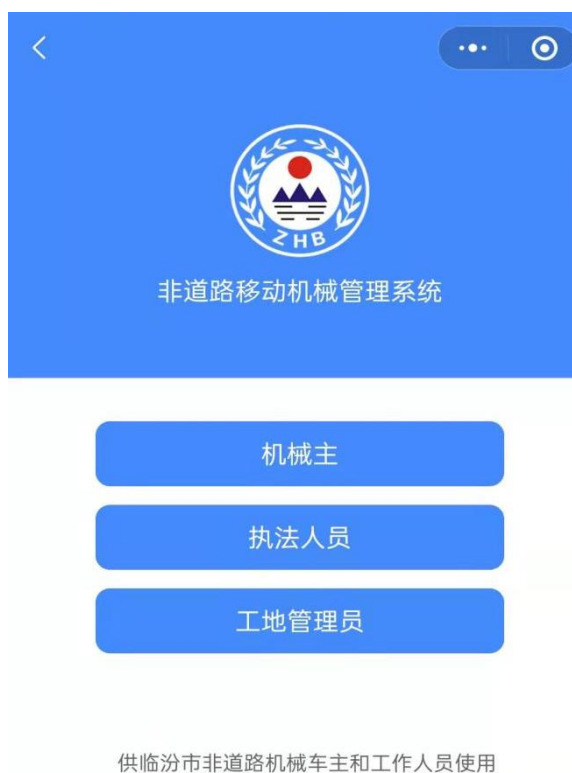
图 3 小程序非道路机械管理进入页面