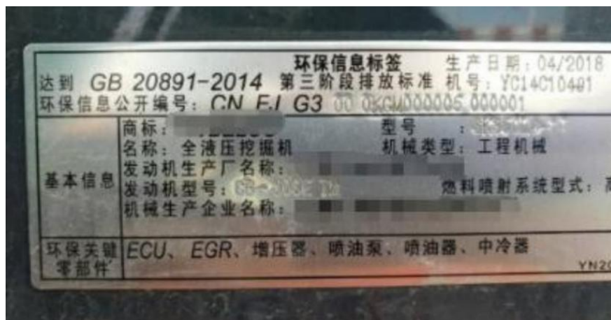
图 12 环保信息标签图

4. 环保信息标签是从 2017 年 7 月开始，在新生产的非道路移动机械上安装的金屬铭牌，上面包含有发动机的环保信息公开编号、机械基本信息、环保关键零部件信息等。带驾驶室的工程机械，安装在驾驶室入口下方、驾驶室外侧等位置；不带驾驶室或者驾驶室周边安装不方便的机械，安装在机体明显且固定的部件上。具体示例详情如图 12 所示。