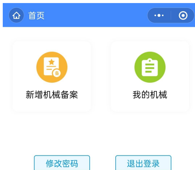
图 18 查看我的机械

点击列表右侧按钮，可以查看机械信息，未通过审核的还可以修改机械信息重新提交审核。