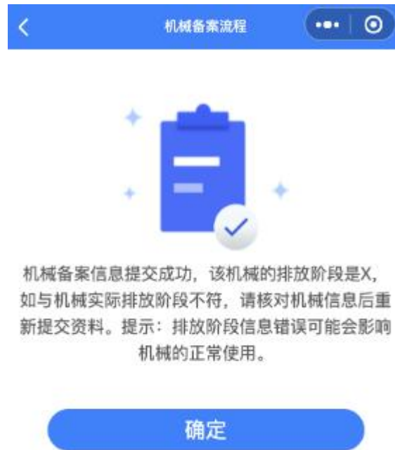
图 16 完成界面图