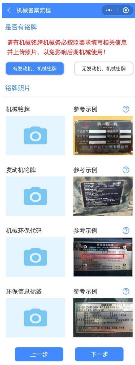
图 8 机械资料图