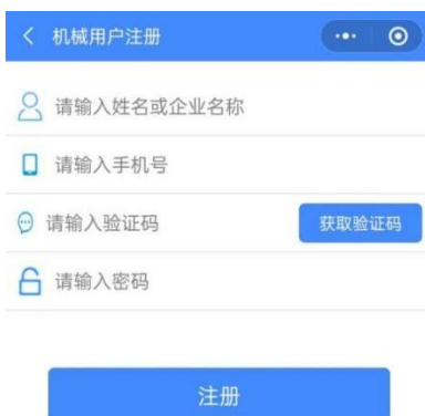
图 2 注册页面

机械用户账号需要用户自行注册，在登录页面下方点击“注册”即可进入注册页面，输入姓名或企业名称、手机号，点击“获取验证码”收到验证码短信后，输入验证码，输入密码，点击“注册”即可完成用户账号的注册。