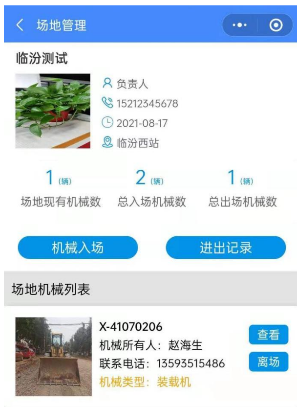
图 9 机械入场页面