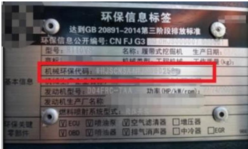
图 11 机械环保代码图

于号(><)。安装在机架或其他坚固的结构件上，在机械外部可以读到。大型机械通常安装在靠近机械前部的右侧。具体示例详情如图 11 所示。