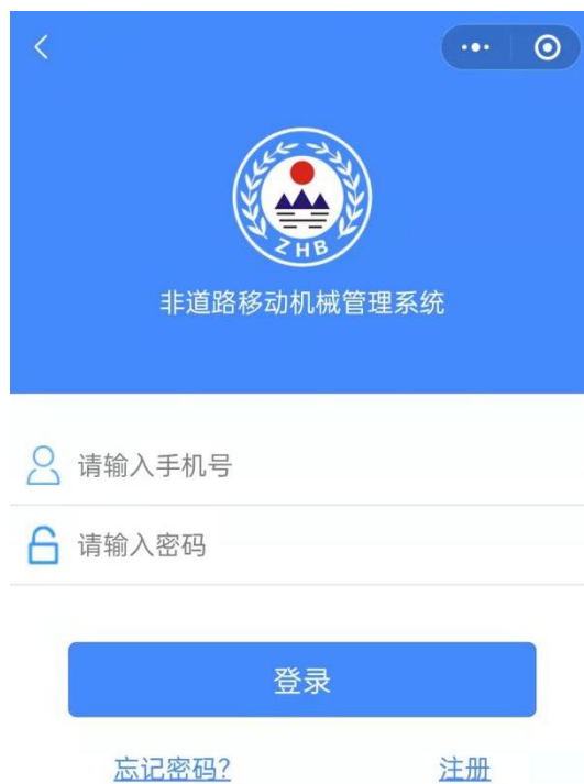
图 6 工地管理员登录页面